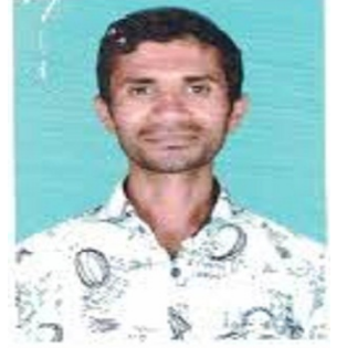
Photo & Specimen Signature of the Candidate