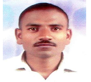
Photo & Specimen Signature of the Candidate